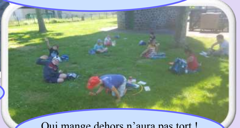
Qui mange dehors n'aura pas tort !