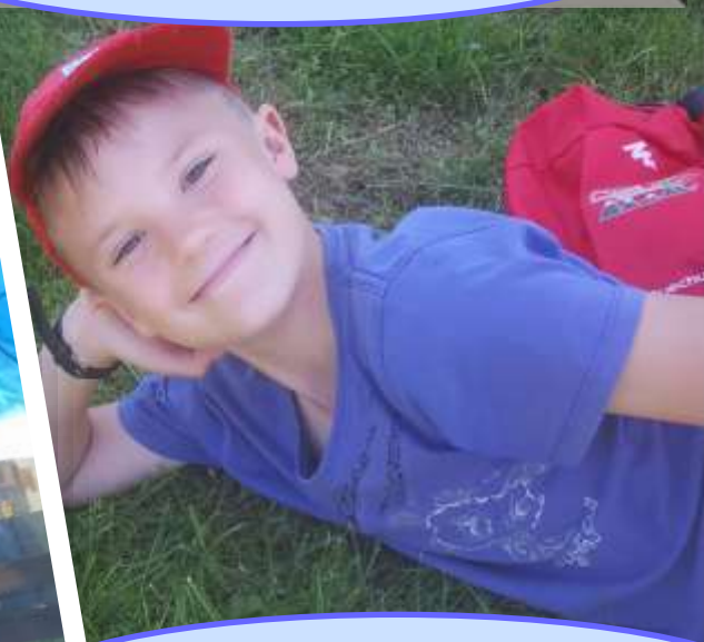
Après le confinement, retour à l'insouciance!