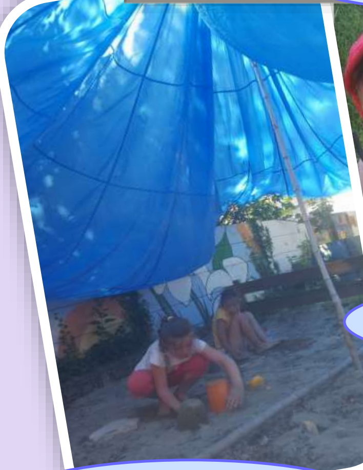
Distanciation sociale même dans le bac à sable !