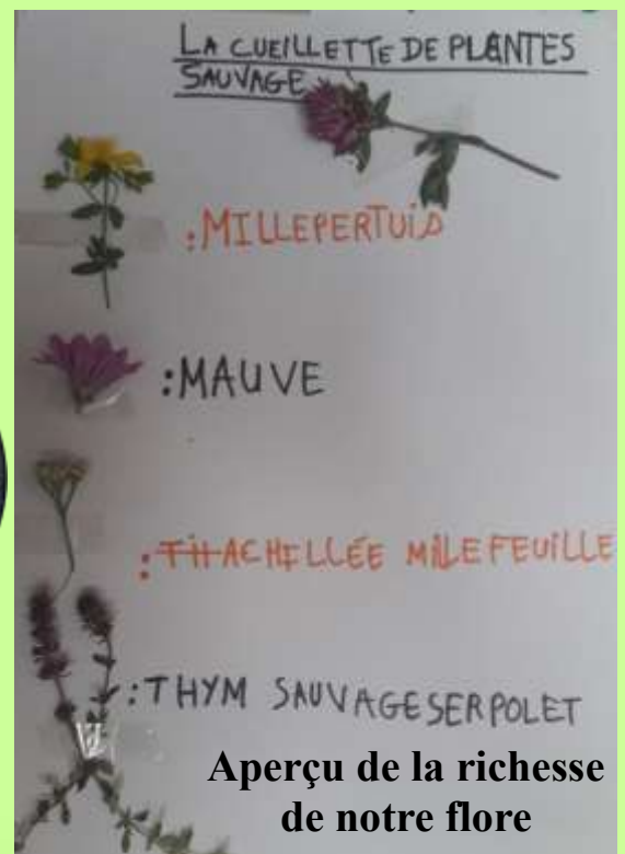
Aperçu de la richesse de notre flore