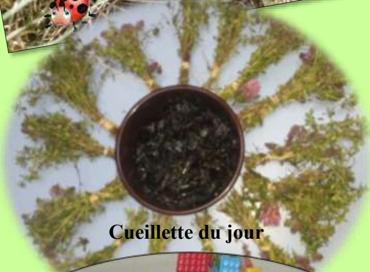
Cueillette du jour

Quand la peur s'en va, elle laisse place à l'émerveillement !