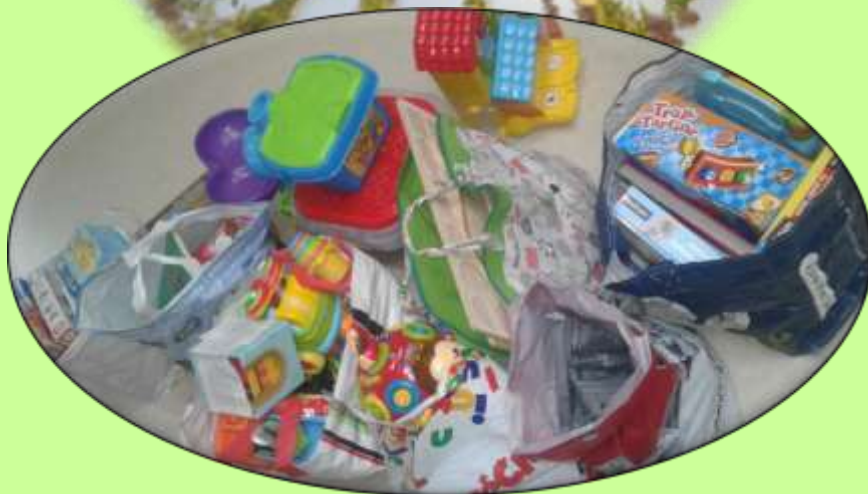
Généreuse collecte pour l'association Croquette du Cœur 46